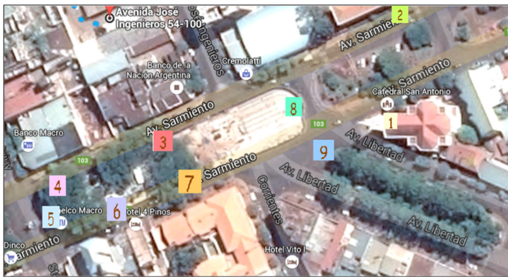
Figura 1: Ubicación de los puntos de medición.

Hasta el momento, y como el proyecto se encuentra en desarrollo, se han tomado registros en cuatro días diferentes, totalizando aproximadamente 10 horas de medición en toda la zona. En la figura 1, se observa el sector de estudio, y los puntos considerados para el análisis.