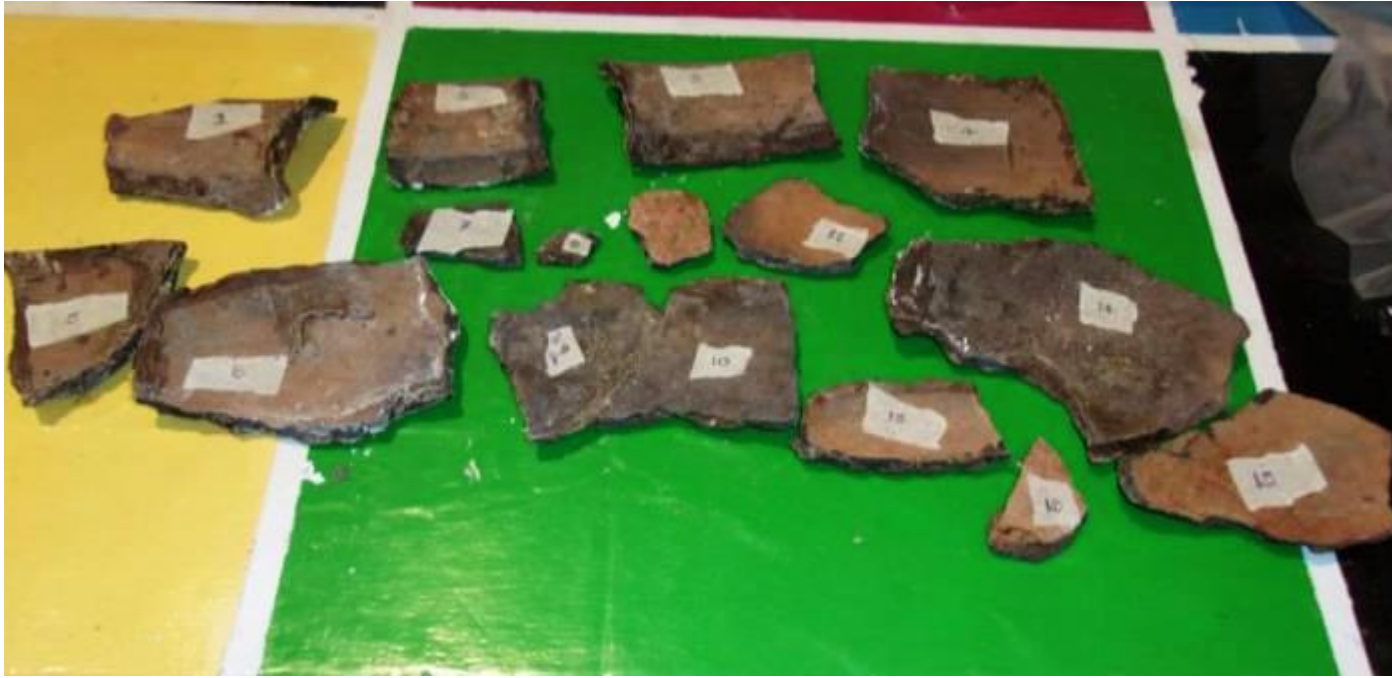
Fragmentos de urna cerámica numerados para iniciar tareas de restauración.

La cerámica, por su resistencia a lo largo del tiempo, es uno de los materiales que de forma abundante aparece en las excavaciones arqueológicas, siendo para esta disciplina un elemento de datación imprescindible. Sin embargo, en un contexto de enterramiento prolongado, el deterioro de los objetos cerámicos es inevitable, lo que demanda establecer un protocolo de actuación para recuperar las piezas con las máximas garantías de seguridad, sin que pierdan la información que éstas puedan aportar como documento histórico.