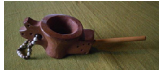
Pipas etnográficas guaraní, en terracota de “ñaú” y con engobe rojo y semillas “lágrima de virgen”.