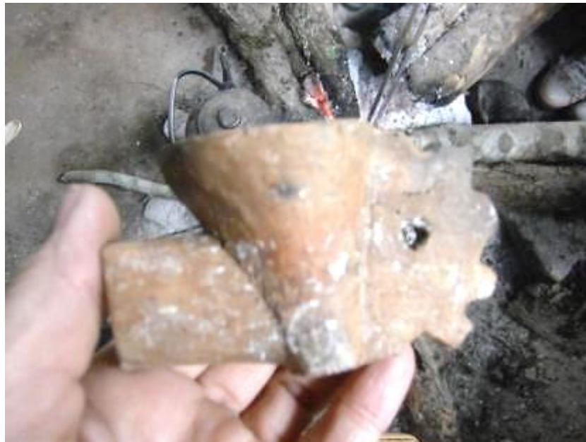
Pipa arquetípica guaraní realizada por Sara.

El “asiento de fogones”, es el lugar donde se reúnen los miembros de la comunidad en torno al fuego para compartir actividades comunitarias como el pirograbado de las tallas en madera y la cocción de la cerámica. Allí, además se toman las decisiones más importantes entre el cacique “